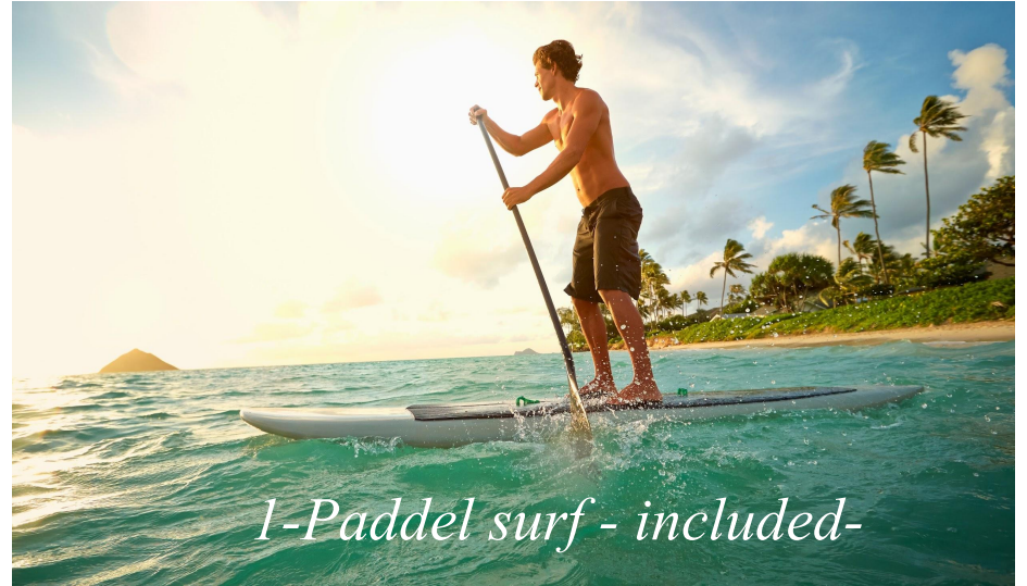
1-Paddel surf - included-